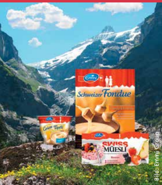
Das Label «Schweiz» droht sich selbst aufzulösen.