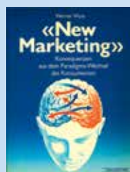
1981 Die Alpha-Omega-Typologie wird entwickelt und erscheint in Buchform.