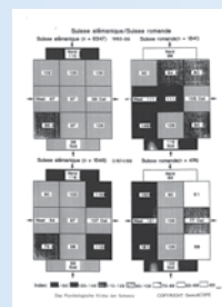
1986 Das Soziogramm (heute Psychogramm) rundet die Analysetools ab.