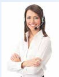
1993 Die Basis für das PKS bilden nicht mehr persönliche, sondern telefonische Interviews.

*Der Autor war bei der Erstauflage von PKS im Jahre 1974 als Studienleiter bei DemoSCOPE tätig. Ab 1984 und bis 1997 war er für die PKS-Studie als Projektleiter und Kundenberater sowie zusammen mit Werner Wyss für Berichte und methodische Weiterentwicklungen tätig. Ab 2001 ist er im Auftrag für die Interpretation der Studie in den jährlichen Berichten für die Subskribenten verantwortlich. Ferner hat er die Überführung der Testmethode von PKS in die MACH-Studien mitgestaltet und begleitet.