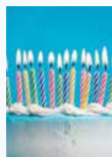
2014 Das Psychologische Klima der Schweiz wird 40.