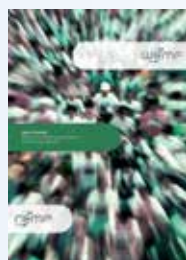
2006 Das PKS wird in die MACH-Studien der WEMF integriert.