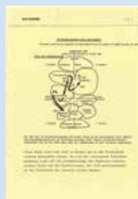
1983 Die erste Psychologische Karte wird veröffentlicht.